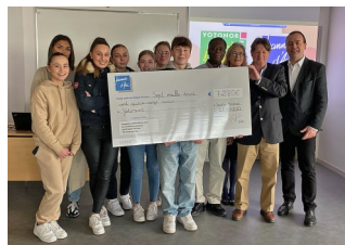
Remise d'une subvention du lycée J d'Arc de Ste Adresse