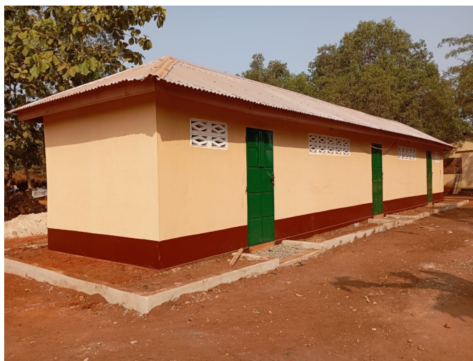
Latrines du collège-lycée construites en 2015 par Yotonor

Pour vos dons : RIB Yotonor FR76 102780216400 0203 5890 129