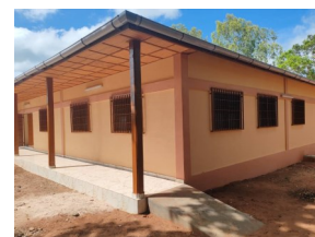
Accès PMI. Coursive éclairée le soir

Le 19 octobre 2024 la réception provisoire est prononcée sans réserve !!!!