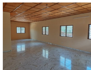
Grande bibliothèque entièrement carrelée