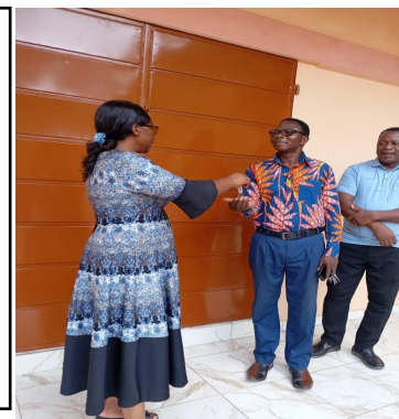
Remise officielle des clefs au proviseur

Et ainsi le 7 novembre la directrice de L'enseignement régional remettait officiellement les clefs au proviseur.