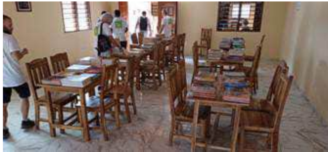
bibliothèque et espace informatique