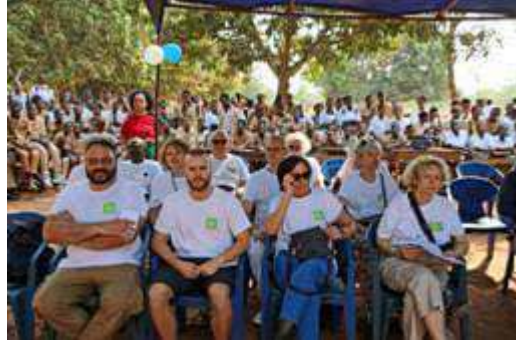
Une partie de la délégation Yotonor