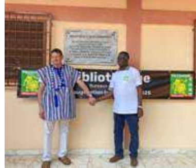
Dévoilement d'une oeuvre offerte Sketch par le groupe théâtre Moment d'émotion