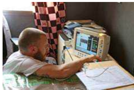
mise en service du Datex Ohmeda

2 Rencontre avec Monsieur Kokoroko, Ministre des Enseignements Primaire, Secondaire, Technique et de l'Artisanat. Après présentation des actions de notre association et de l'ampleur des résultats déjà obtenus, le ministre nous promet la fourniture et l'installation d'étagères à la bibliothèque, un apport d'ordinateurs complémentaires, un poste de surveillant destiné à l'initiation à l'informatique des élèves et en surveillance du matériel.