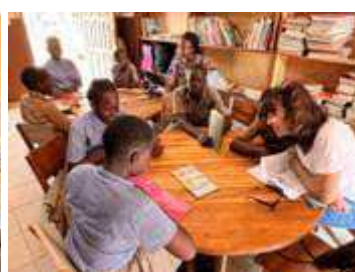
aide aux devoirs