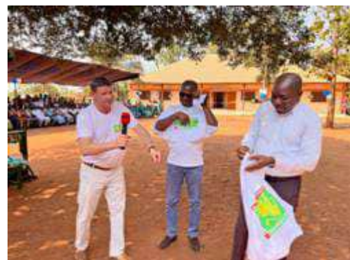
Remise symbolique du tee shirt Yotonor