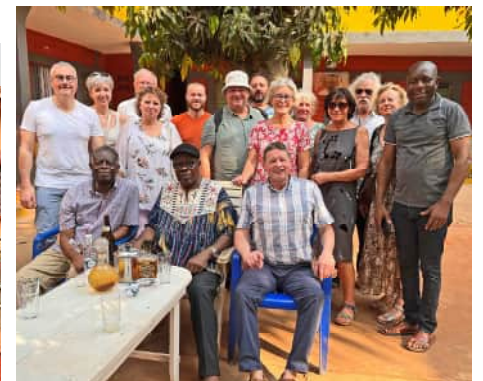
à la chefferie du village