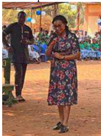
Discours du Maire