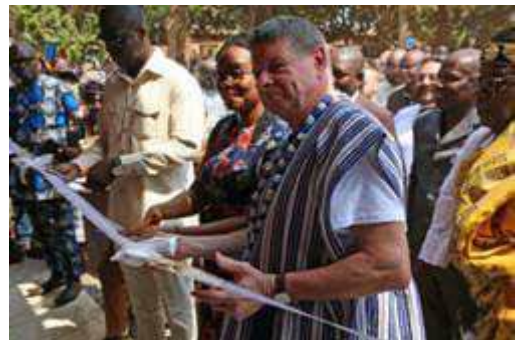
On coupe le ruban !!!!