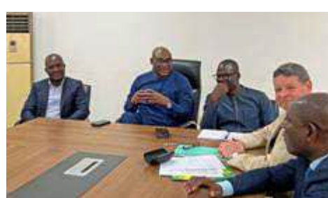
Ecoute attentive et promesses d'actions pour l'amélioration des conditions d'enseignement à Tchekpo-Dédékpoe.

3 Visite au lycée, reçus par Madame La Censeur. Nous constatons avec joie la qualité de la réalisation. Le bâtiment entièrement carrelé est lumineux et ventilé naturellement de sorte qu'on s'y trouve aussitôt bien. Les tables et chaises fournies par le ministère, en bois, donnent une ambiance chaleureuse aux locaux et, assurément, l'envie d'étudier.