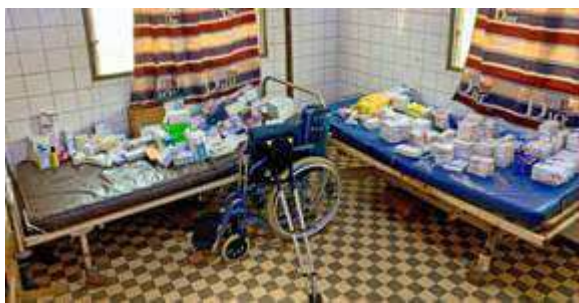
dons exceptionnels au dispensaire