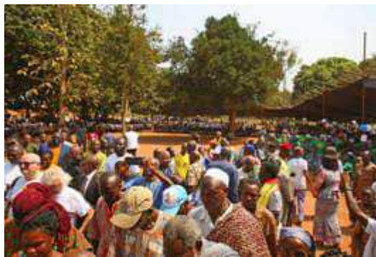
Il y a beaucoup de monde !