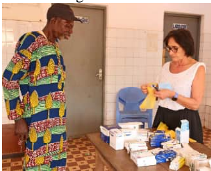
médicaments sur prescription