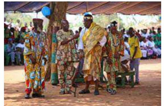
Accueil du chef de Canton