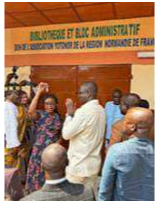
Remise d'une tenue "Bétékéli" Très émouvant discours des élèves Plantation symbolique Remise officielle des clefs