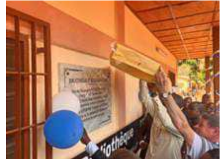
Matériel pour infirmerie Mot du Vice Président Groupe de danseurs Dévoilement d'une plaque en marbre