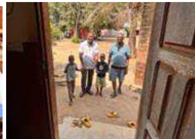
deux nouveaux arrivants