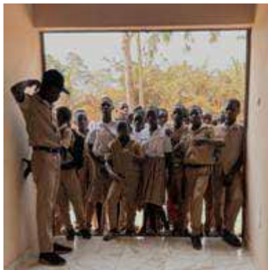
Les élèves veulent rentrer !

Hymne national par la chorale du collège. Accueil du Chef du Canton. Allocution de Madame Le Maire et remise d'une tenue traditionnelle. Intervention du Président de Yotonor. Marche Républicaine par la chorale du lycée. Discours du Ministre (représenté par son directeur de cabinet). Intermèdes des chanteuses du village et du groupe de danseurs national. Discours de remerciements des élèves. Remise des clefs par Yotonor à Mme Le Maire qui les remet au Proviseur. Mise en terre des plans de chênes d'Allouville-Bellefosse.