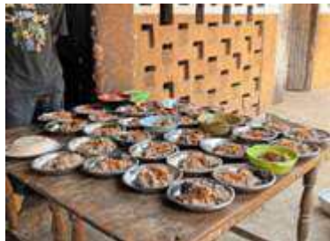
repas prêt après l'école